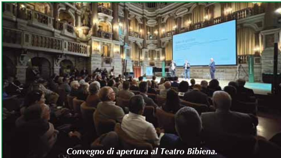
Convegno di apertura al Teatro Bibiena.

Confronto sull'agricoltura del futuro a Mantova